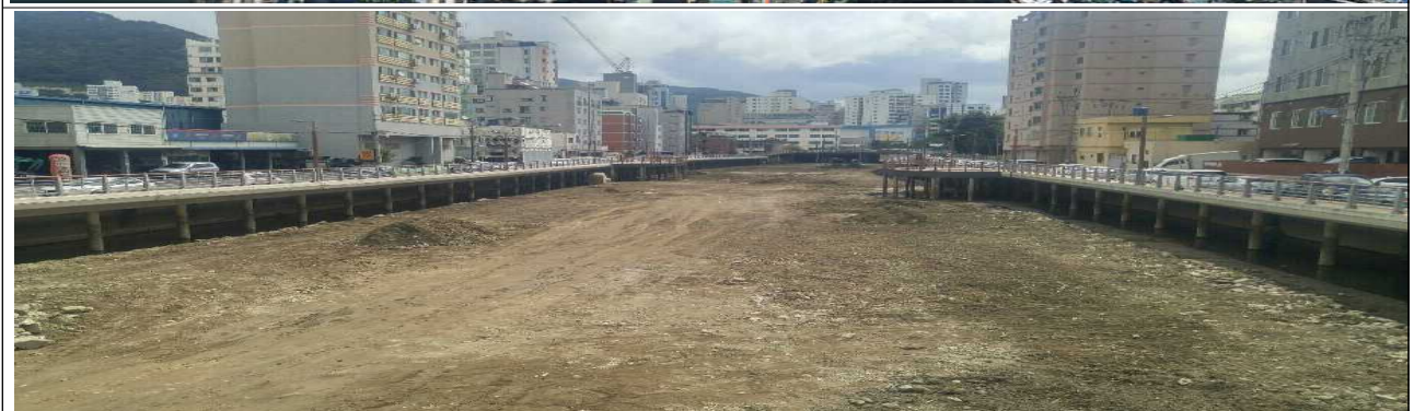
괴정천 유역 차집시설 정비 및 준설공사