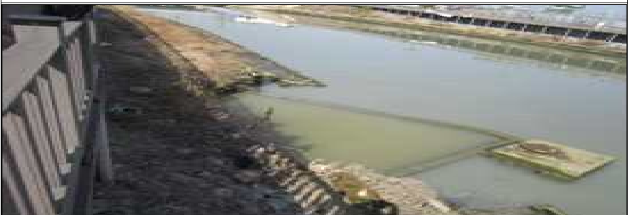
괴정천 강변교 하부 차집시설 정비공사