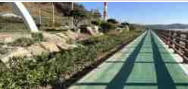
해안산책로 그린웨이 조성