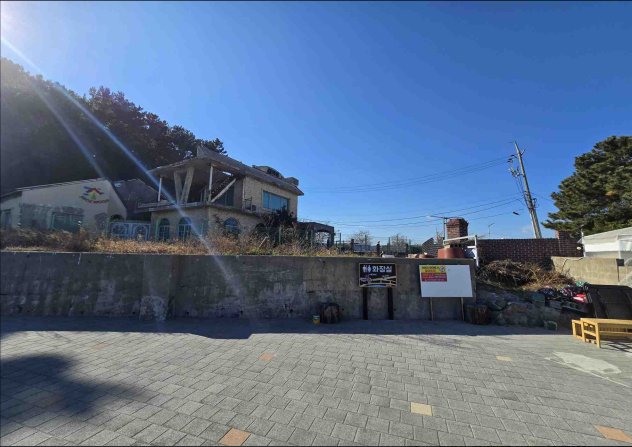
방법용 CCTV 신규 설치 전