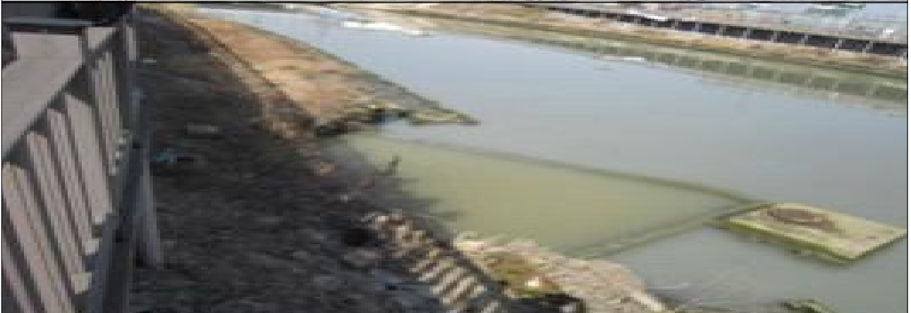
괴정천 강변교 하부 차집시설 정비공사