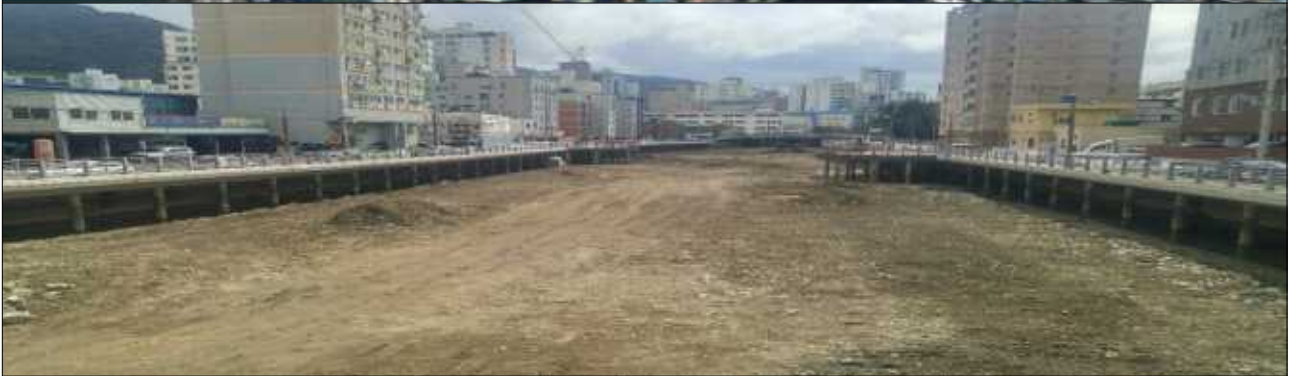
괴정천 유역 차집시설 정비 및 준설공사