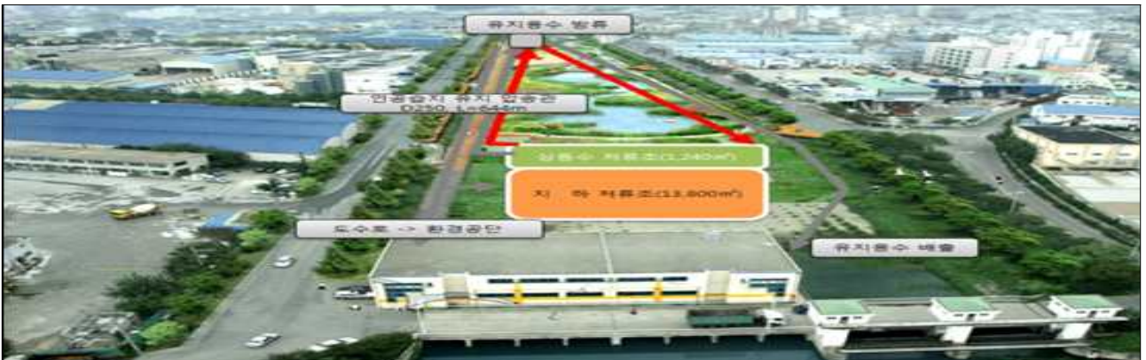
장림유수지 유지용수 개선