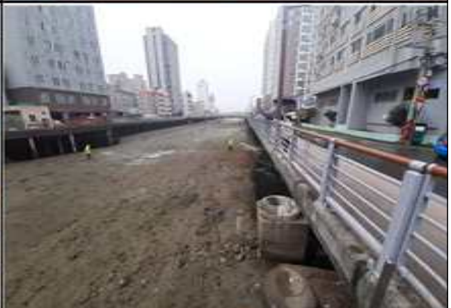
괴정천 개거부 유용미생물(EM) 살포