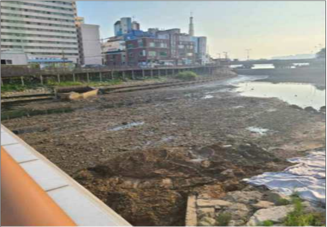
2020년 괴정천 준설공사